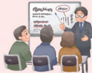
カルチャースクール