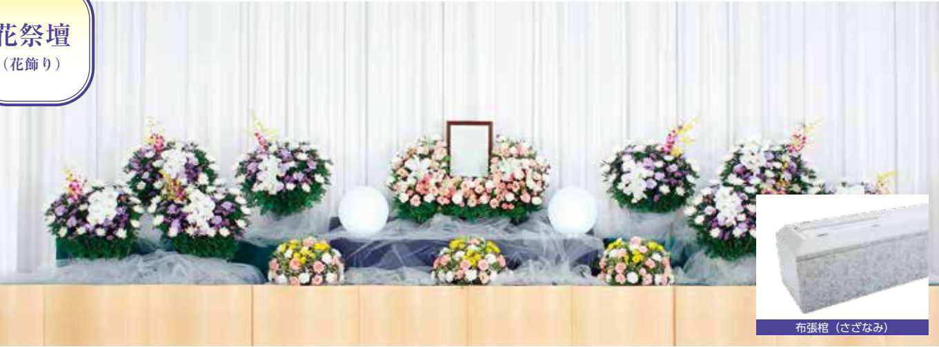
※花祭壇の写真はデザインの一部です。ご喪家の意向を伺いコーディネートいたします。 ただし、季節によって提供できない種類がございますので、詳しくは係員にお尋ねください。 ※籠花は含まれません。