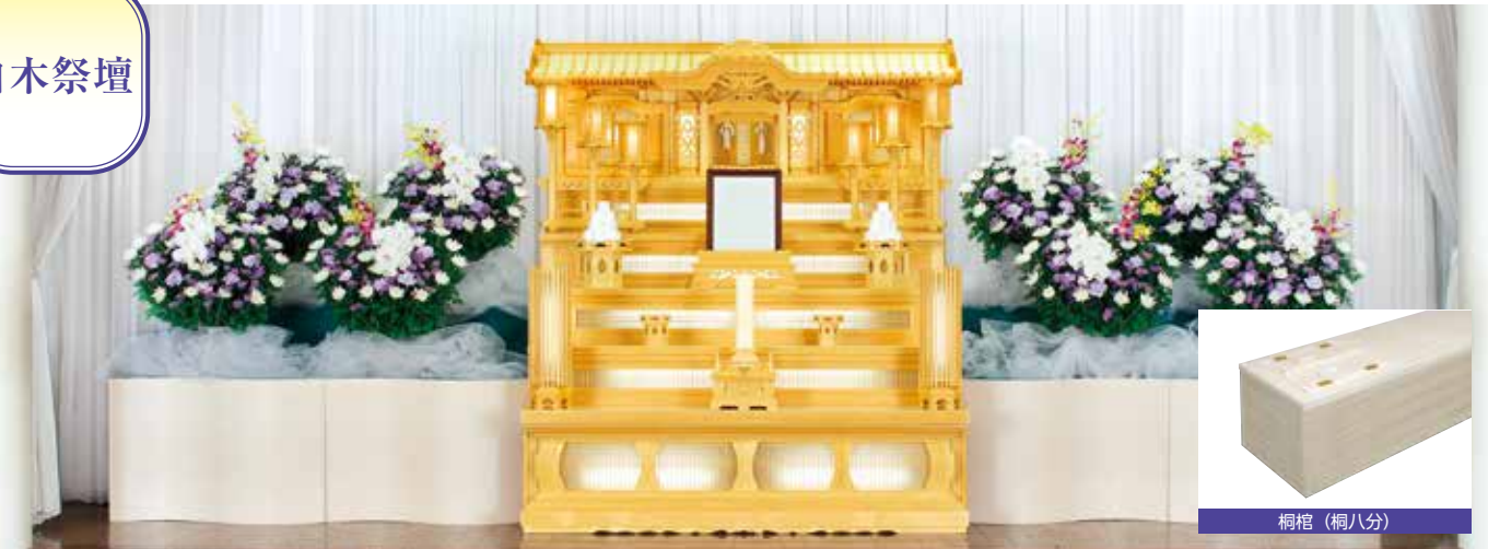
※白木祭壇のデザインは斎場や式場の間取り等により異なります。 ※籠花は含まれません。