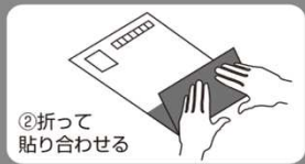
②折って貼り合わせる