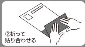
②折って 貼り合わせる