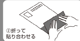
②折って 貼り合わせる