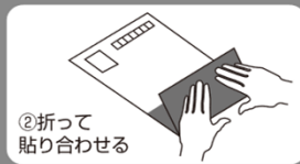
②折って 貼り合わせる