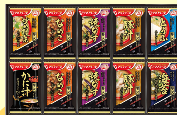
お味噌汁贅沢ギフト