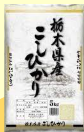
コシヒカリ 5 kg