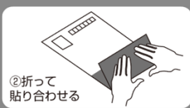
②折って貼り合わせる