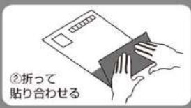
②折って貼り合わせる