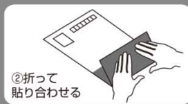
②折って貼り合わせる