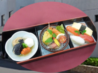
画像はイメージです。 実際の内容と異なる可能性があります。