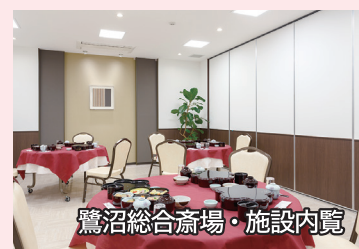
鷺沼総合斎場・施設内覧