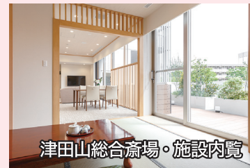
津田山総合斎場・施設内覧