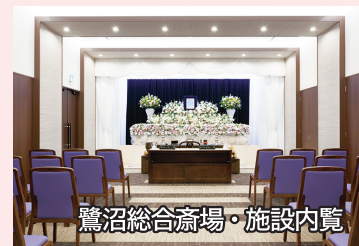
鷺沼総合斎場・施設内覧