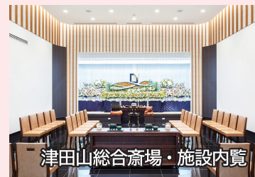
津田山総合斎場・施設内覧